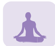
Position du papillon