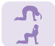
Position du chat (Dos creux et dos rond)