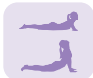
Position du cobra