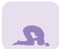
Position du lapin