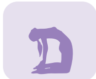
Position du chameau