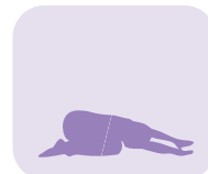
Position de la tortue