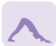
Position du chien