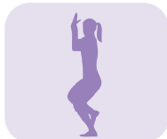
Position de l'aigle